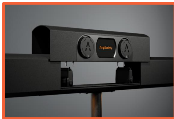
Modulärt för enkel & pålitlig installation.