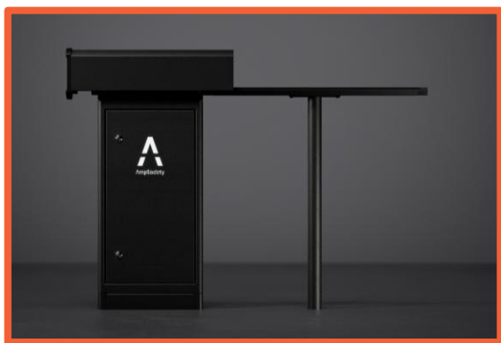
Centraliserad laddteknik för driftsäkerhet.

Amp5 är ett modulärt, skalbart och framtidssäkrat laddsystem med stöd för ren OCPP. Med holistisk systemarkitektur levererar Amp5 marknadens mest pålitliga laddupplevelse.